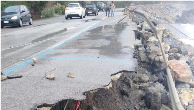
Erosione costiera strada del Mingiardo – Camerota (SA)

A seguire alcuni dei tratti di costa campanana più colpiti dai fenomeni erosivi: