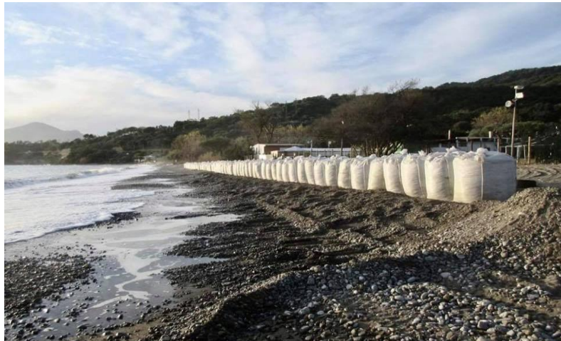
Spiaggia di Villammare (SA)