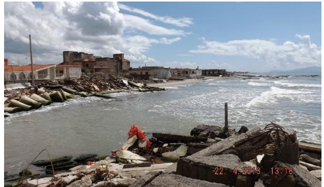
Marina Bagnara di Castel Volturno (CE)